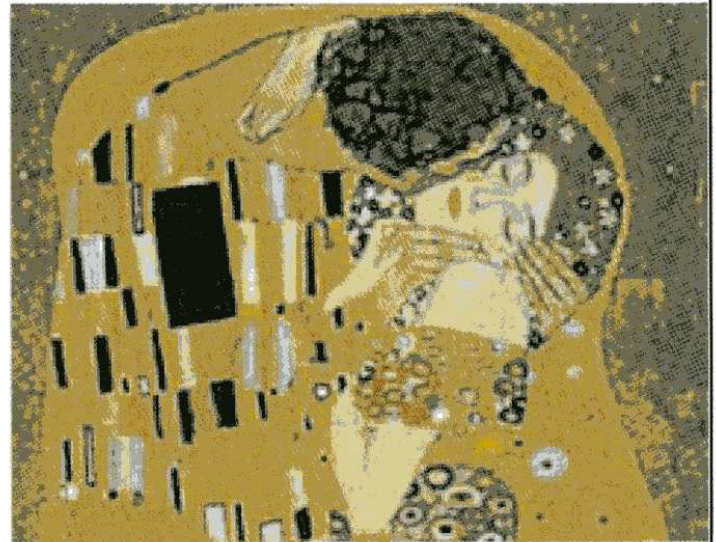
La coppia così come dovrebbe essere.

edere scusa quando si litiga. Vorremmo che fossero sinceri nei nostri confronti e non ci facessero soffrire. Due persone le definiamo innamorate quando hanno cose in comune, il piacere di dividere dei momenti felici e tristi, risolvere dei problemi insieme discutendone. Non tutti i rapporti, però, possono essere felici, ma bisogna avere presente l'idea che ci deve essere rispetto di se, della propria libertà e dell'altra persona che ci è di fronte.