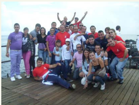
FOTO DI GRUPPO ACIREALE

MESSA DA PARTE QUESTA FANTASTICA ESPERIENZA TANTE ALTRE USCITE CI ASPETTANO, MA L'APPUNTAMENTO PIU' IMPORTANTE PER NOI E' L'ORGANIZZAZIONE E REALIZZAZIONE DEL PRESEPE VIVENTE AL CODACCHIO, APPUNTAMENTO FISSO ORMAI DEL NATALE TORREMAGGIORESE.