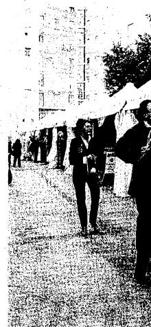
FOGGIA La fiera del volontariato ospitata a Foggia

Premiati istituti e circoli didattici sensibili alla «tematica»